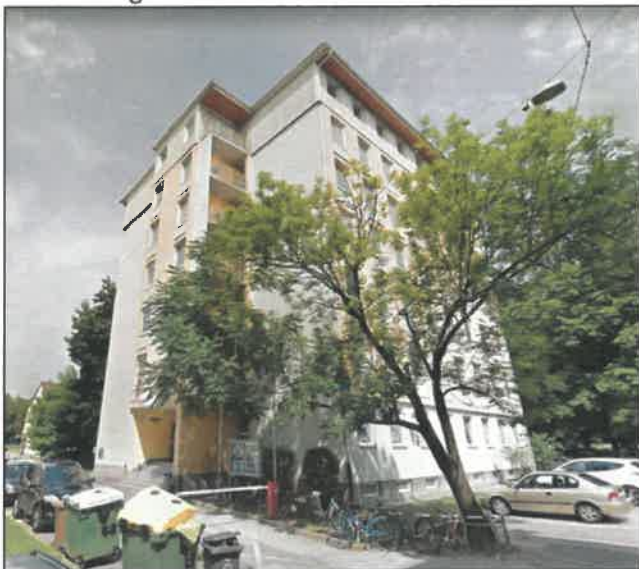
Slika 1: Pogled na Študentski dom 1