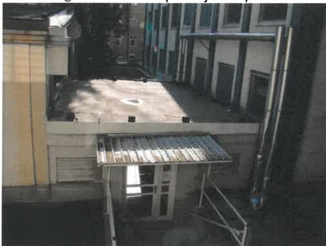
Slika 3: Pogled na S fasado (zunani vhod)

Kvaliteta uporabnosti se je v času uporabe zmanjšala, pričakovani standardi uporabe pa se zvišujejo.