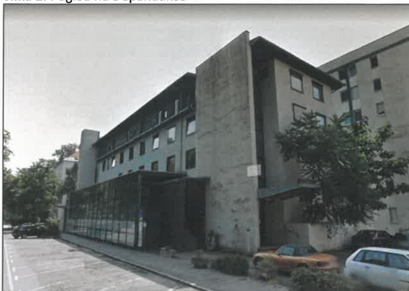
Slika 2: Pogled na Depandanso